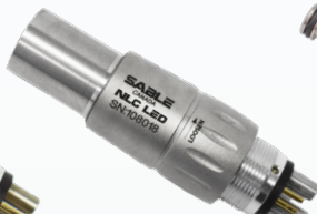
2000108 Type NSK 6 trous DEL