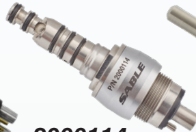
2000114 Type KAVO 4 trous Sans fibre optique