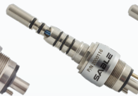
2000116 Type KAVO 6 trous Halogène