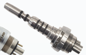
2000105 Type KAVO 5 trous Multiflex