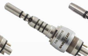
2000119 Type KAVO 6 trous DEL