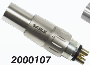
2000107 Type NSK 6 trous Halogène

Achetez-en 4 et obtenez-en 1 gratuitement*