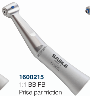
1600215 1:1 BB PB Prise par friction