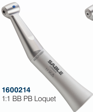
1600214 1:1 BB PB Loquet