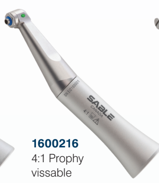
1600216 4:1 Prophy vissable