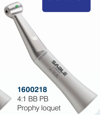
1600218 4:1 BB PB Prophy Loquet