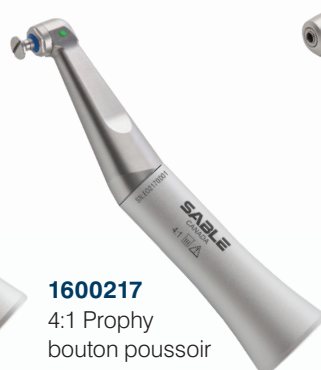
1600217 4:1 Prophy bouton poussoir